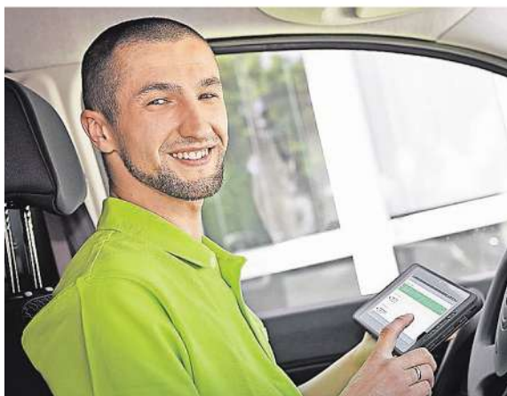
Digitaler Weitblick: Ein Fahrer plant seine Touren mit Software der Couplink-AG.